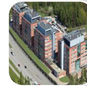
Innopoli 3 Espoo